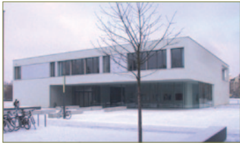
Haus IV, Hörsaal-Gebäude

Mittwoch, 3. März 2010 Hochschule Zittau/Görlitz (FH), Theodor-Körner-Allee 16